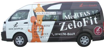
ゼロフィットバス

1~18の番号は時刻表とリンクしています。時刻表はホームページから閲覧・ダウンロードしていただけます。